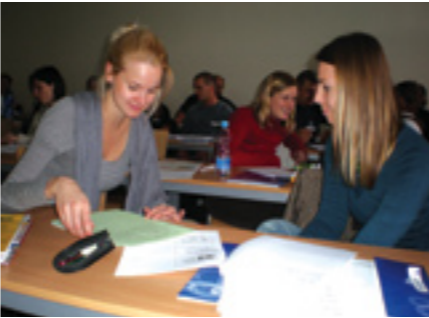
Interní výcvik BKB 2009

Výrazné jsou zastoupeny věkové kategorie 25–40 let (34 %) a 40–50 let (23 %). V roli oběti trestného činu byl evidován příchod 464 uživatelů služby, v roli příbuzných 88, známých a svědků 49. Mezi uživateli se objevil pouze jeden pachatel a 217 uživatelů přišlo v předeliktním stadiu (např. chronicky páchané přestupky s eskalující tendencí).